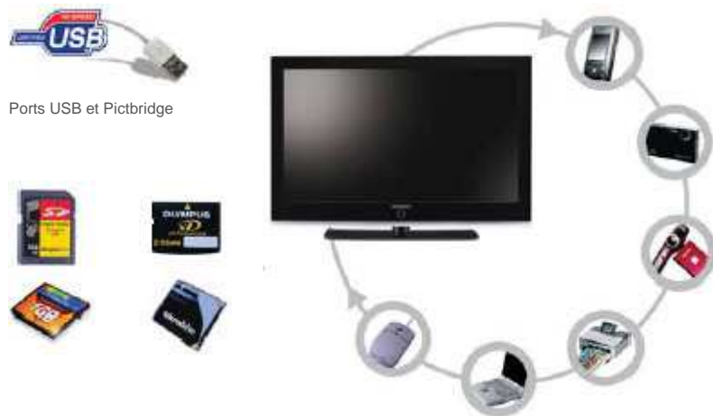
Ports USB et Pictbridge